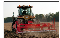
Preparación del Suelo