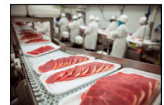
Procesando: Carne, frutas, arboles, verduras, etc.